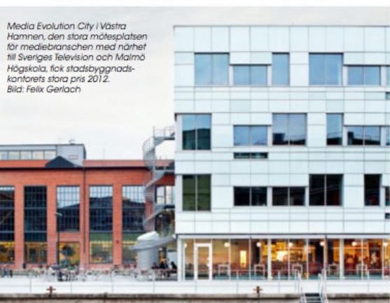
Media Evolution City i Västra Hamnen, den stora mötesplatsen för mediebranschen med närhet till Sveriges Television och Malmö Högskola, fick stadsbyggnadskontorets stora pris 2012.

Kort tid efter (2012-2015) tog JUUL | FROST fram Sjöjungfrun, en 18 500 kvadratmeter stor fastighet bestående av två fristående byggnader som bildar en kvartersstruktur och som utgörs av en hästskeformad tredelad och öppen struktur samt en självständig volym. Byggnaden når sin högsta punkt i nordöstra hörnet och sluttar ner mot parken. Kvartersstrukturen bildar ett inre semioffentligt rum som blir de boendes informella mötesplats, ett gårdsrum på 1 500 kvadratmeter. Den karaktäristiska byggnaden där en del av huskroppen går från fem till elva våningsplan byggdes av Midroc Property Development. Här finns 187 bostäder i storlekarna 1-4 rum och kök. Sjöjungfrun är miljö- och hållbarhetscertifierad nivå silver.