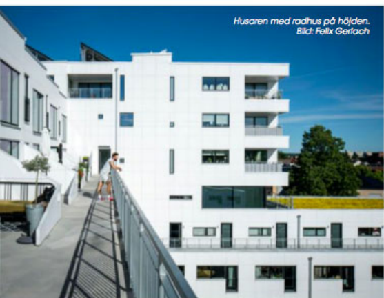
Husaren med radhus på höjden.