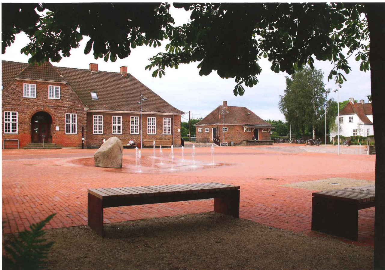
Kig ud på pladsen mod stationsbygningerne under de eksisterende kastanjetræer, der står i felter af slotsgrus View out onto the square toward the station building, from under the existing chestnut trees that stand in plots of palace gravel

Vitaliseringen af stationsområdet som byens naturlige samlingspunkt er et effektivt bystrategisk greb med store kvalitative gevinster. Hedehusene kendetegnes ved, at byen på forskellig vis gennemskæres af tunge trafikale korridorer, der alle vanskeliggør fysiske sammenhænge på tværs. Derfor er det helt afgørende for den fremtidige identitet at få skabt et samlet mødested for beboere, pendlere og besøgende.