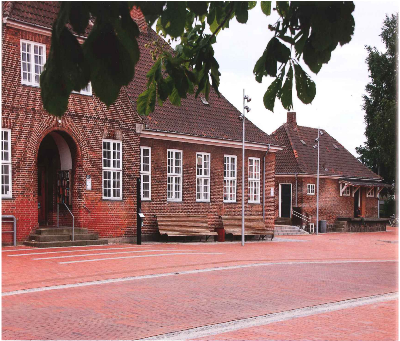
Teglbelægningen lægger op til de historiske stationsbygninger. Ophold og invitationer langs facaden The brick paving plays up to the historical station buildings. Seating and information along the facade

hen. Stationspladserne er reduceret til transitrum med den ene funktion at komme fra et punkt til et andet.